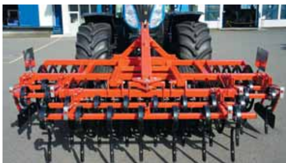
フロントディスク グレゴワール・ベッソン社 プラニディスク PK300

近年フロントリネージュ付トラクターが一般的になり、農作業の更なる効率アップが可能となりました。このSMIシーダーをリヤにセットし、フロントに砕土/整地作業を行うローラーなどの作業機と組み合わせて使用することで、プラウ耕後にわずか1工程で砕土～整地～鎮圧～播種までの作業が可能となります。